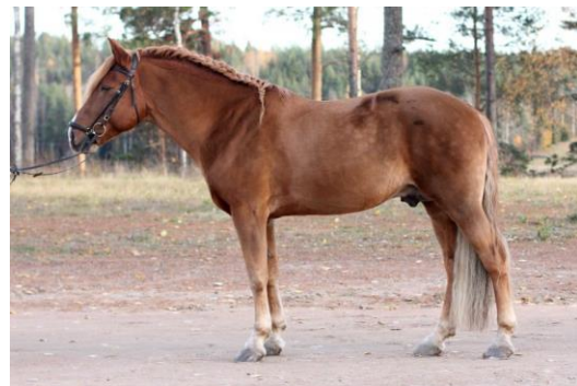
Kuva 1. Esimerkkikuva katalogiin tulevasta oriin rakennekuvasta.

HUOM! Katalogiin tarvittava oriin rakennekuva (mielellään sivusta, koko hevosen kuva) tulee toimittaa 3.3.2022 mennessä sähköpostitse osoitteeseen pirje@hippos.fi . Kuvan lähettäjä vastaa kuvan käyttöoikeuksista. Määräpäivän jälkeen lähetettyjä kuvia ei huomioida.