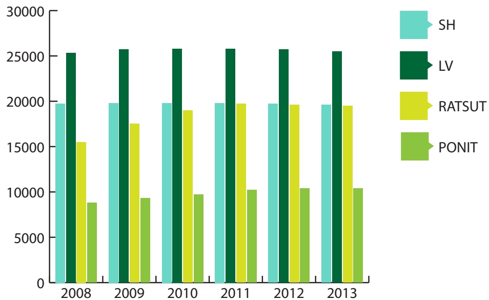
Taulukko 3: Hevosten kokonaismäärät Suomessa vuosina 2008 - 2013. Lähde: Suomen Hippos ry.

*Suomenhevosten kokonaismäärä. Sisältää suomenhevosen kaikki käyttömuodot.